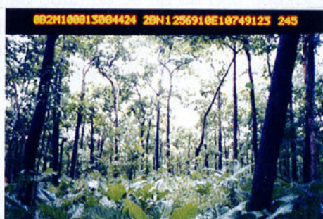
Hình 3: Ước lượng độ che phủ tán lá dựa trên ảnh chụp thực địa

Trong đó S là lượng đất bị xói mòn (tấn/ha/năm) và C là độ che phủ tán lá. Sau khi áp dụng công thức này ta sẽ được bản đồ nhạy cảm xói mòn như trình bày trên hình 2d. Phân cấp mức độ nguy hiểm được chia